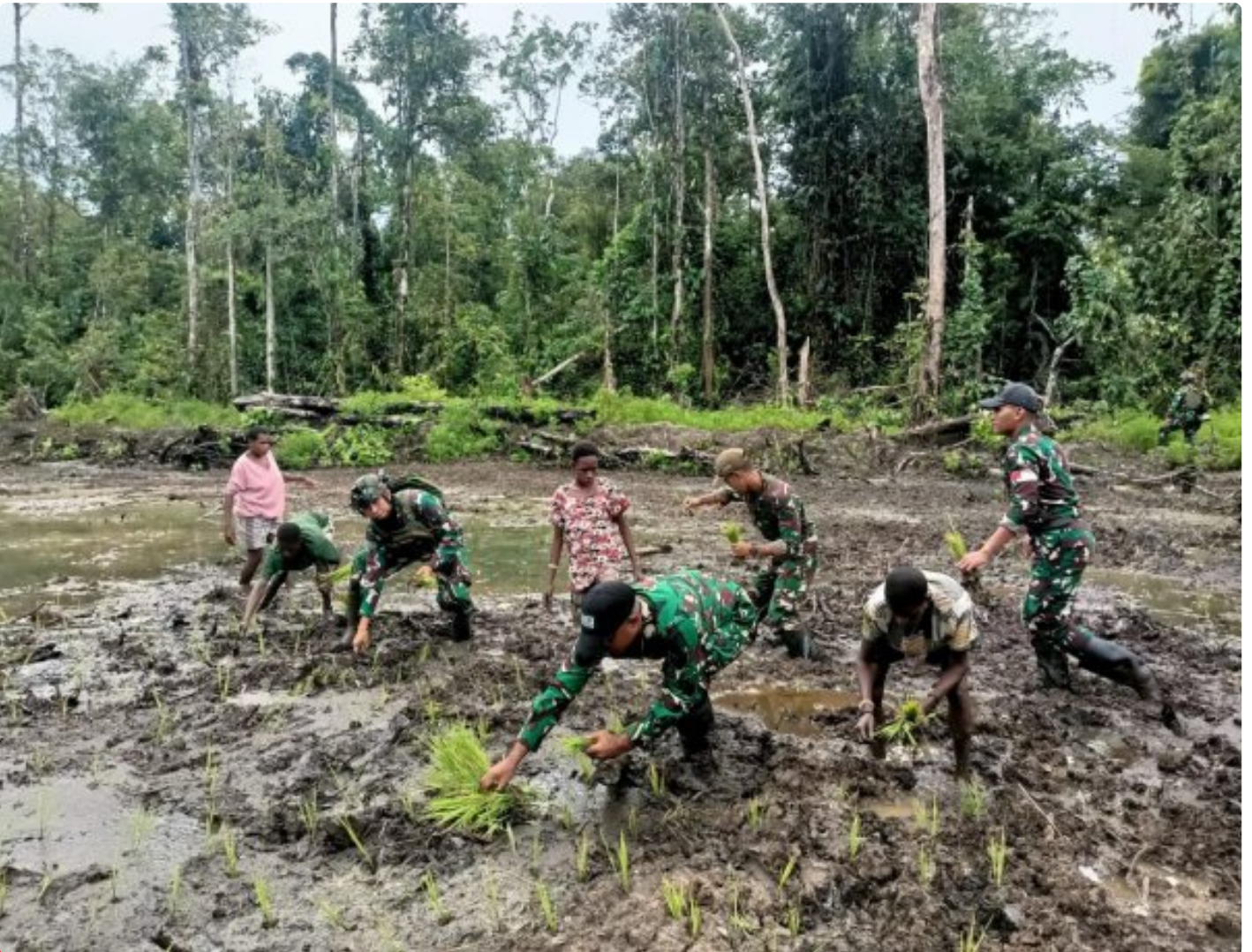
Foto: Satgas Pamtas Mobile RI-PNG Yonif 503/Mayangkara menggalas program ketahanan pangan yang melibatkan langsung warga Kampung Mumugu, Distrik Krepkuri, Kabupaten Nduga, Selasa (07/01/2025).

NDUGA- Dalam upaya membangun kesejahteraan masyarakat di wilayah penugasan Papua Pegunungan, Satgas Pamtas Mobile RI-PNG Yonif 503/Mayangkara